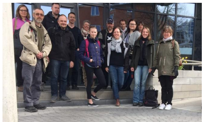
Deltagarna på resan utanför samhällsbyggnadshuset.

Besöket inleddes med att vi fick göra en rundvandring och höra om deras specialdesignade kontorslandskap med aktivitetsbaserade arbetsplatser. Intressant att se och höra om. De har ett skåp med sina tillhörigheter och sätter sig på en plats som är lämplig för dagens arbetsuppgifter. Sedan följde flera intressanta presentationer. Vi fick höra hur de marknadsför GIS internt och hur de tänker kring det. En stadsbyggnadsarkitekt berättade om hur han arbetar, och har gjort i cirka 10 år, med geografisk information som verktyg vid stadsplanering. Två utvecklare berättade om utveckling i open source och visade flera exempel på karttjänster som de har eller är på väg att publicera.