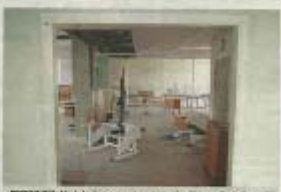
EYDESSON. Nu pågår processen som ska förvandla tidigare bankens villor i centrum till lägenheter.